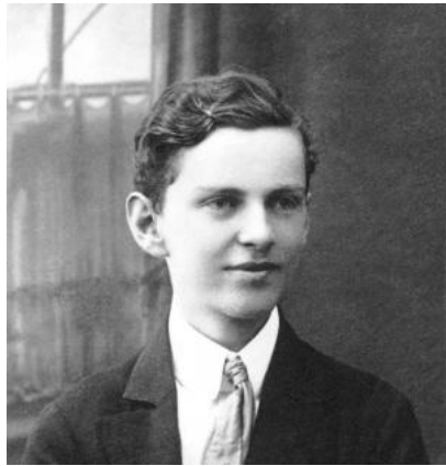
Blaženi Ivan Merz: 10. svibnja

Ivan je rođen 16. prosinca 1896. u Banja Luci. Gimnaziju završava u rodnome gradu a zatim po želji roditelja kratko pohađa vojnu akademiju te odlazi studirati u Beč. Studij prekida zbog Prvog svjetskog rata, kada je mobiliziran i poslan na talijansku bojišnicu na kojoj je proveo dvije godine. Ondje u paklu rata doživljava obraćenje i obraća se Bogu. Po završetku rata nastavlja studij književnosti, najprije u Beču a zatim u Parizu na Sorboni i Katoličkom institutu. Za vrijeme studija već je živio svetački. Nakon dovršetka studija Ivan se seli u Zagreb gdje postaje profesorom francuskog jezika i književnosti na Nadbiskupskoj klasičnoj gimnaziji. U Zagrebu i doktorira. Kao laik polaže zavjet čistoće a svoje slobodno vrijeme posvećuje odgoju mladeži u katoličkoj organizaciji Hrvatski Orlovski savez, pod geslom „Žrtva, euharistija, apostolat.“