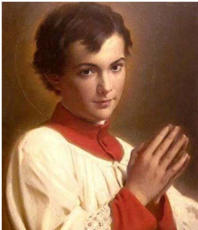
Učenik don Ivana Bosca.

Jedan od najmlađih svetaca Katoličke Crkve.